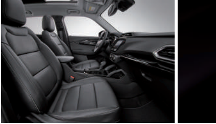
젯 블랙 & 빅토리아 헤링본 포인트 인테리어(LT & Premier)