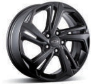
18인치 하이글로스 블랙 알로이 휠 (RS 미드나잇 전용)