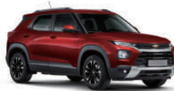
NEW 밀라노 레드 (GFM)