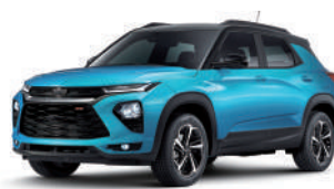
이비자 블루 (GHC)