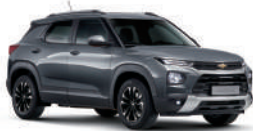
새틴 스틸 그레이 (GYM)