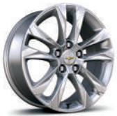
17인치 실버 알로이 휠 (LT 전용)