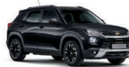
모던 블랙 (GB0)