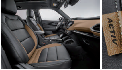
아몬드 버터 투톤 & 워시드 데님 포인트 인테리어(ACTIV)