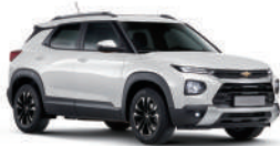
스노우 화이트 펄 (GP5)