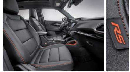
젯 블랙 & 레드 포인트 인테리어(RS)

※ 상기 이미지는 컴포트 패키지 선택 시 천공 천연 가죽시트가 적용된 이미지임 (LT & Premier)