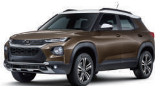
제우스 브론즈 (G7G)