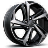
18인치 RS 머신드 알로이 휠 (RS 전용)