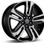
NEW 18인치 ACTIV 머신드 알로이 휠 (ACTIV 전용)