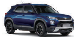
NEW 모나코 블루 (GGK)