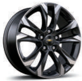
17인치 머신드 알로이 휠 (Premier 전용)