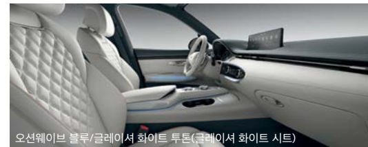
오션웨이브 블루/글레이저 화이트 투톤(글레이저 화이트 시트)