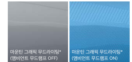
마운틴 그래픽 무드라이팅* (앰비언트 무드램프 OFF)