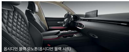
옵시디언 블랙 모노톤(옵시디언 블랙 시트)