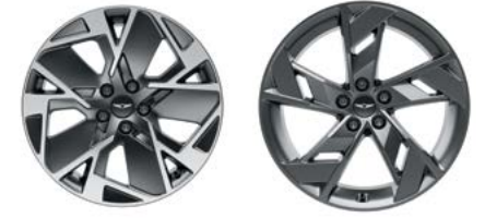
19인치 다이아몬드 컷팅 휠