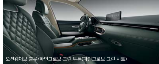
오션웨이브 블루/파인그로브 그린 투톤(파인그로브 그린 시트)