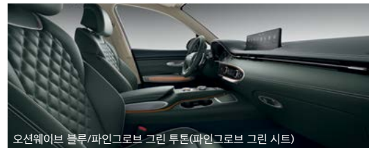
오션웨이브 블루/파인그로브 그린 투톤(파인그로브 그린 시트)