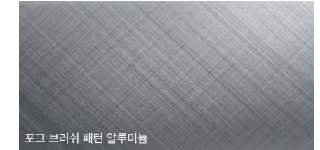
포그 브러쉬 패턴 알루미늄