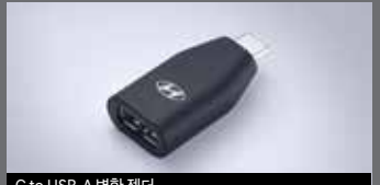
C to USB-A 변환 젠더