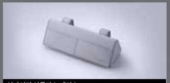
선바이저 선글라스 케이스