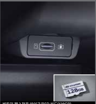
빌트인 캠 2 전용 마이크로SD 카드(128GB)