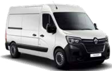
미네랄 화이트 Mineral White