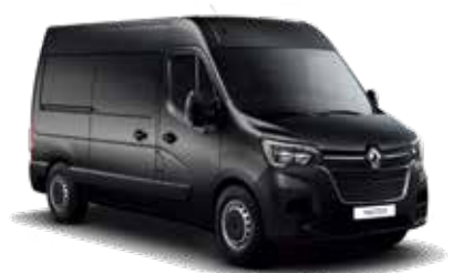
메탈릭 블랙 Metallic Black