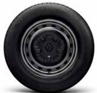
16" 스틸휠 & 휠커버 225/65R16 타이어(콘티넨탈)