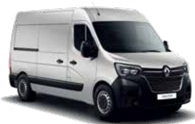
실버 그레이 Silver Gray